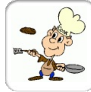
Cucina sportiva - die sportliche... 78 Mitglieder